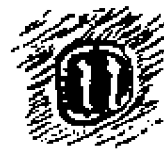
Рис. 1а. Эмблема Нюрнбергской гильдии оружейников

Рисунок 1 может дать некоторое представление о форме и внешнем виде доспехов Шотта, но никакой рисунок не может по справедливости воздать мастерству оружейника и форме доспехов, которые в действительности отливают темным стальным блеском,